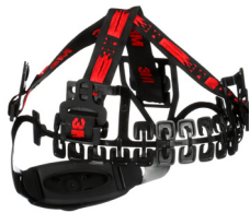
Repuesto de la suspensión del casco de seguridad 3M™ SecureFit™ Serie-H